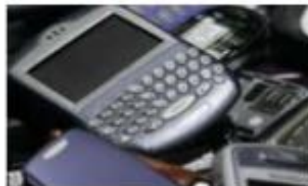
FABRICACIÓ DE MÒBILS