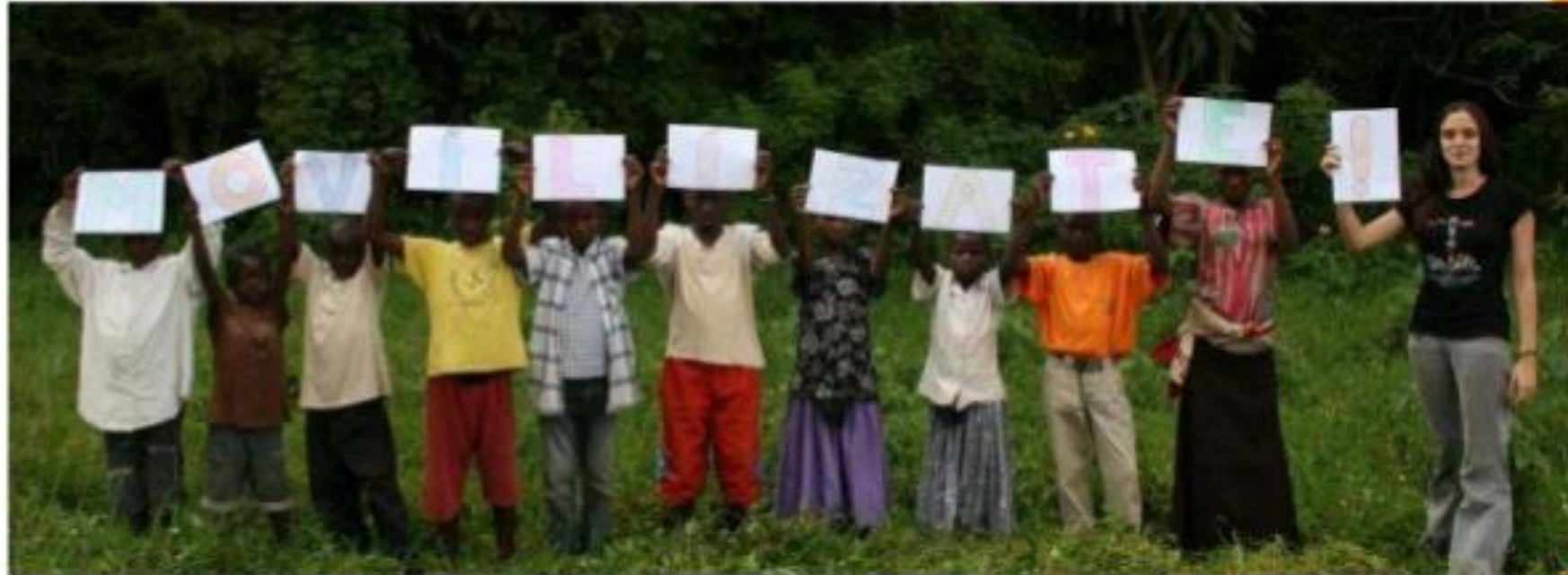
Grup Roots&Shoots de Lwiro (RDC) que rep materials educatius de l'IJG.