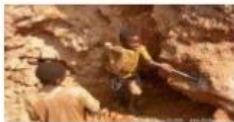
EXTRACCIÓ DE COLTAN