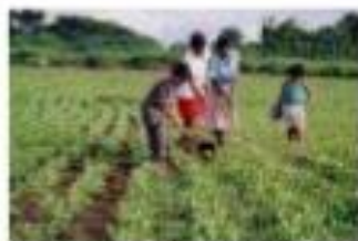
EDUCACIÓ I DESENVOLUPAMENT