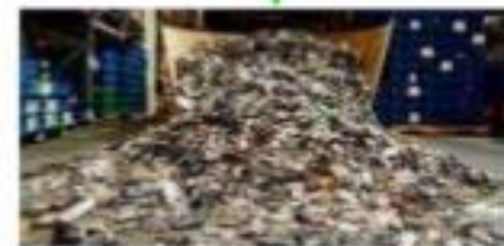
RECICLA EL TEU MÒBIL